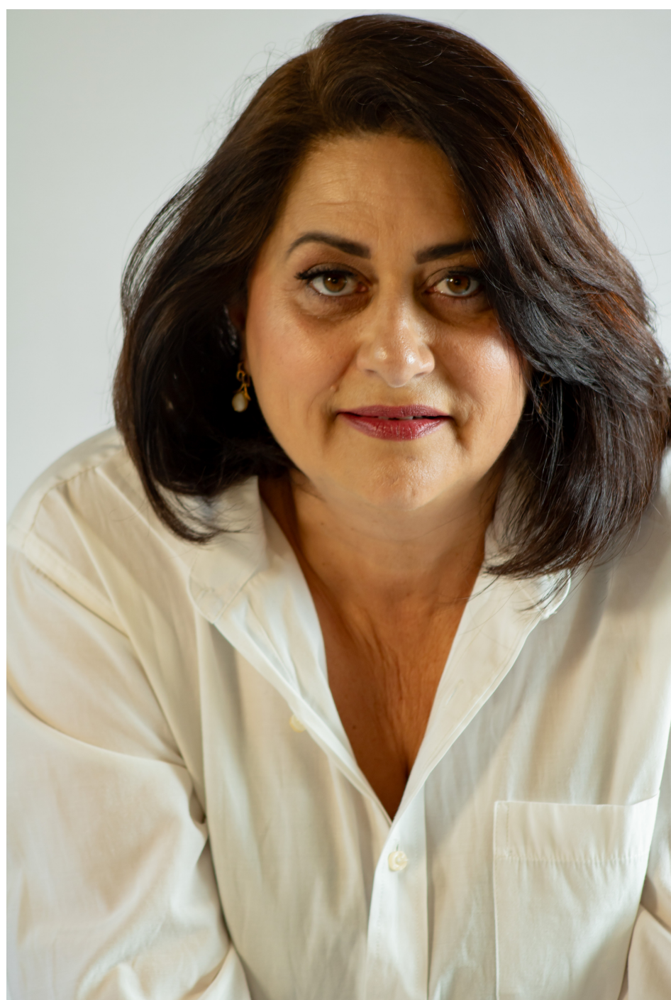
Foto de perfil atual

Os ensaios de marca pessoal ou retrato corporativo, por exemplo, ajudam a melhorar sua presença online e sua estratégia digital.